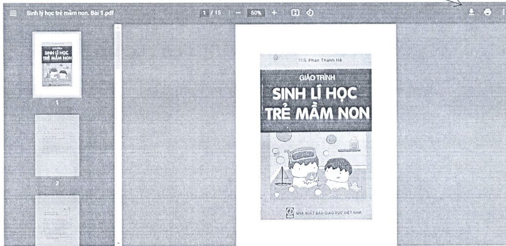
(Hình 3. Giao diện tài liệu cần xem)